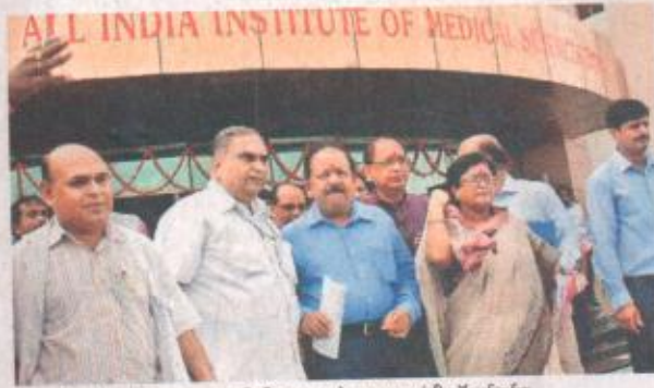
फुलवारीशरीफ स्थित एम्स का निरीक्षण करते स्वास्थ्य मंत्री डॉ हर्षवर्धन.

केंद्रीय स्वास्थ्य मंत्री डॉ हर्षवर्धन ने कहा कि प्रधानमंत्री नरेंद्र मोदी का सपना देश को गरीबी व कुपोषण से मुक्त कराने का है. पूर्व प्रधानमंत्री अटल बिहारी वाजपेयी के जन्मदिन पर 25 दिसंबर को पटना एम्स को राष्ट्र को समर्पित किया जायेगा. पटना का एम्स आधुनिक तकनीक से लैस होगा व विश्व के सर्वोच्च अस्पतालों में शामिल होगा. शनिवार को फुलवारीशरीफ स्थित