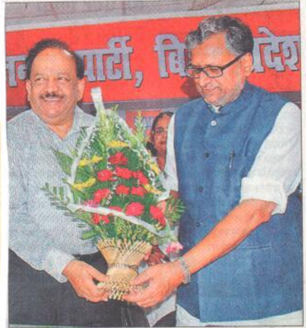
भाजपा कार्यालय में रविवार को केंद्रीय स्वास्थ्य मंत्री डॉ. हर्षवर्द्धन का स्वागत करते पूर्व उपमुख्यमंत्री सुशील कुमार मोदी।