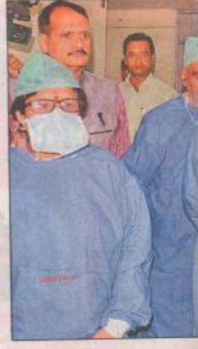
एम्स में भर्ती बच्चे के स्वास्थ्य की जानकरी लेते व अस्पताल का निरीक्षण करत केन्द्रीय स्वास्थ्य मंत्री डॉ. हर्षवर्द्धन