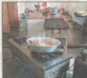
Chapatis left in the open at AIIMS-Patna kitchen on Saturday.

A second-year MBBS student, told The Telegraph : "Tasty or even nutritious food is a big ask at the institute mess. We usually get dishes with potato and none with green vegetables. We have be-