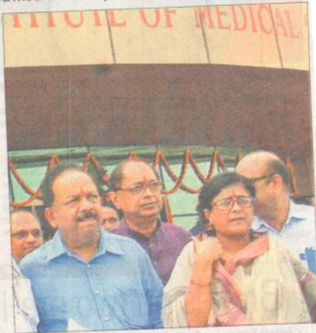
■ Union minister for health and family welfare Dr Harsh Vardhan at AIIMS-Patna on Saturday.

Directing the AIIMS-Patna administration to overcome all infrastructural and academic deficiencies by December 25 next, so that AIIMS-P could be formally launched by Prime Minister Narendra Modi to coincide with former prime minister Atal Behari