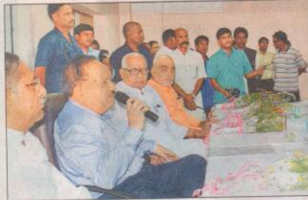
छात्रों से बात करते डॉ. हर्षवर्द्धन

एम्स के कोने-कोने घूमे डॉ. हर्षवर्द्धन : समस्याओं से रूबरू होने के लिए केन्द्रीय स्वास्थ्य मंत्री डॉ. हर्षवर्द्धन एम्स के कोने-कोने घूमे। उन्होंने ओपीडी व वाडों में जाकर मरीजों से बातचीत तो हॉस्टलों में जाकर छात्र-छात्राओं से। उन्होंने तमाम विभागों में जाकर चिकित्सकों से बात की और उनकी समस्याएं पूछी।