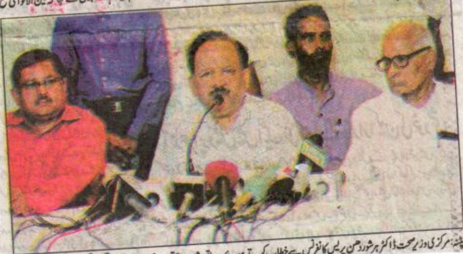
پنڈ: مرکزی وزیر صحت ڈاکٹر ہرشن وردھن پریس کانفرنس سے خطاب کرتے ہوئے۔ ساتھ میں ریاستی وزیر صحت رام دھنی سنگھ دوگر۔

پنڈ۔ 22 جون۔ مرکزی وزیر صحت ڈاکٹر ہرشن وردھن مرکزی صحت کے سکریٹری لہور اور دیگر افسروں نے 20 سے 22 جون تک بھار کا دورہ کیا۔ اس دورہ کا مقصد انسفلنٹس پھیلتے سے حال ہی میں ریاست میں بچوں کی ہوری اموات کے متعلق زینی حقائق کا جائزہ لینا تھا۔ ڈاکٹر ہرشن وردھن نے مظفر پور ضلع میں کچھ متاثرہ گاؤں، شری کرشن میڈیکل کالج ہاسپٹل کچھریال ہاسپٹل کے وارڈ کا دورہ بھی کیا۔ مرکزی وزیر صحت ڈاکٹر ہرشن وردھن نے بھار کے مظفر پور سمیت کئی اضلاع میں انسفلنٹس (دماغی بخار) جیسی علامت والی بیماری کے سبب بڑی تعداد میں