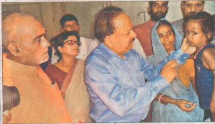
पटना एम्स में भरती बच्चे को देखते केंद्रीय स्वास्थ्य मंत्री डॉ. हर्षवर्धन. साथ में है सांसद रामकृपाल यादव.