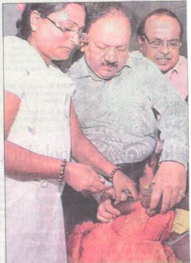
• Union health minister Dr Harsh Vardhan at a Kanti hospital in Muzaffarpur on Sunday.

He asked the senior health officials to make a plan to motivate workers and nursing staff deployed in the remote areas.