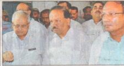
मुजफ्फरपुर स्थित एसकेएमसीएच का निरीक्षण करते केंद्रीय स्वास्थ्य मंत्री डॉ. हर्षवर्द्धन।

दुनिया में अलग पहचान होगी पटना एम्स की -6