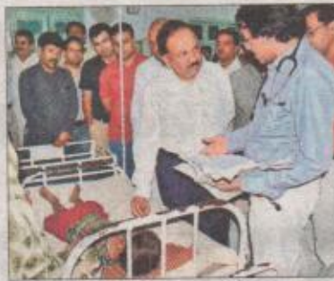
एडएस पीड़ित बच्चों को देखते केंद्रीय स्वास्थ्य मंत्री.

मुजफ्फरपुर व आसपास के जिलों में फैली एडएस बीमारी की वजह कुपोषण नहीं है व न ही बीमारी में किसी तरह के वायरस की पुष्टि हुई है. अभी तक इसके किसी बैक्टीरिया का भी पता नहीं चला है. ऐसे में बीमारी किस वजह से हो रही है इसका पता लगाया जाना जरूरी है. बड़े पैमाने पर शोध का काम होना चाहिए. ये बातें केंद्रीय स्वास्थ्य मंत्री डॉ हर्षवर्धन ने एस्केएमसीएच में एडएस पीड़ित बच्चों को देखने के बाद कहीं. केंद्रीय