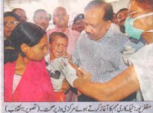
مظفر پور: ٹیکہ کاری مہم کا آغاز کرتے ہوئے مرکزی وزیر صحت۔

ٹیکہ کاری کے بعد پریس کانفرنس سے خطاب کرتے ہوئے وزیر نے کہا کہ مرکزی حکومت اس بیماری کے خاتمہ کیلئے ریاستی حکومت کی ہر طرح سے مدد کرنے کیلئے تیار ہے