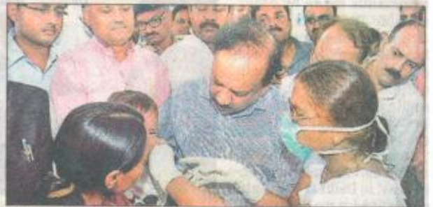
Union minister for health and family welfare Dr Harsh Vardhan at a PHC in Muzaffarpur on Sunday.