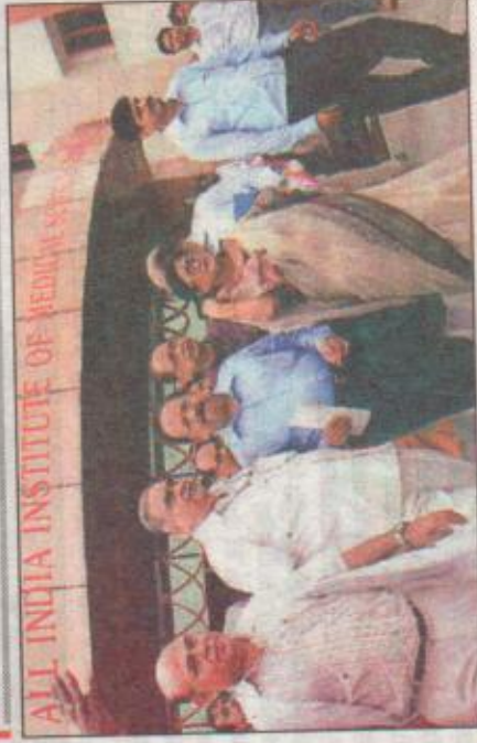
एम्स का निरीक्षण कर बाहर निकलते डॉ. हर्षवर्द्धन। (पेज 6 भी देखें)

मुजफ्फरपुर-दरभंगा मेडिकल कॉलेज में खुलेंगे रिसर्च सेंटर