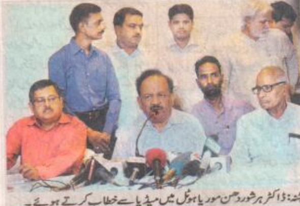
پنڈت ڈاکٹر ہرشوردھن موریا ہوسٹل میں میڈیا سے خطاب کرتے ہوئے۔

شاہ پور پنجیت کے آٹھن ہائی مرکز میں بچوں کو جاپانی انسفاٹیکس کا ٹیکہ لگایا۔ اس سے قبل مرکزی وزیر صحت نے ایس پنڈت کا معائنہ کیا اور وہاں دستیاب خصوصیات، او پی ڈی، آپریشن ٹیبلر، جانچ سہولیات اور ہاسٹل کا جائزہ لیا۔ انہوں نے اسپتال میں ٹرانا سینٹر اور انکریسی کی صورت میں دیکھ بھال کرنے والے مرکز سمیت دیگر خصوصیات کا بھی جائزہ لیا۔ ایس کے اسٹاف، طالب علموں، فیکلٹی کے ممبران سے خطاب کرتے ہوئے کہا کہ ایس پنڈت کو جدید ٹیکنالوجی سے لیس کر کے ملک ہی نہیں بلکہ دنیا کے بہترین ادارے کے طور پر تیار کرنا ان کا اور سابق وزیر اعظم شری بہاری واجپئی کا خواب ہے۔ اس کے لئے انہوں نے ادارے کے ڈائریکٹر اور فیکلٹی کے ممبران سے مسلسل کوشش کرنے کو کہا۔ ساتھ ہی انہوں نے اس منصوبے کی ایکڑیکو پیٹیل کو ہر ممکن کوشش کرنے اور اسے ۲۰۱۳ دسمبر ۲۰۱۳ تک مکمل کرنے کو بھی کہا ہے۔ مرکزی وزیر نے خواہش ظاہر کی کہ سابق وزیر اعظم شری بہاری واجپئی کے یہ پیمانہ اس موقع پر ایس پنڈت وزیر اعظم نریندر مودی ملک کو وقف کرنا چاہتے ہیں۔