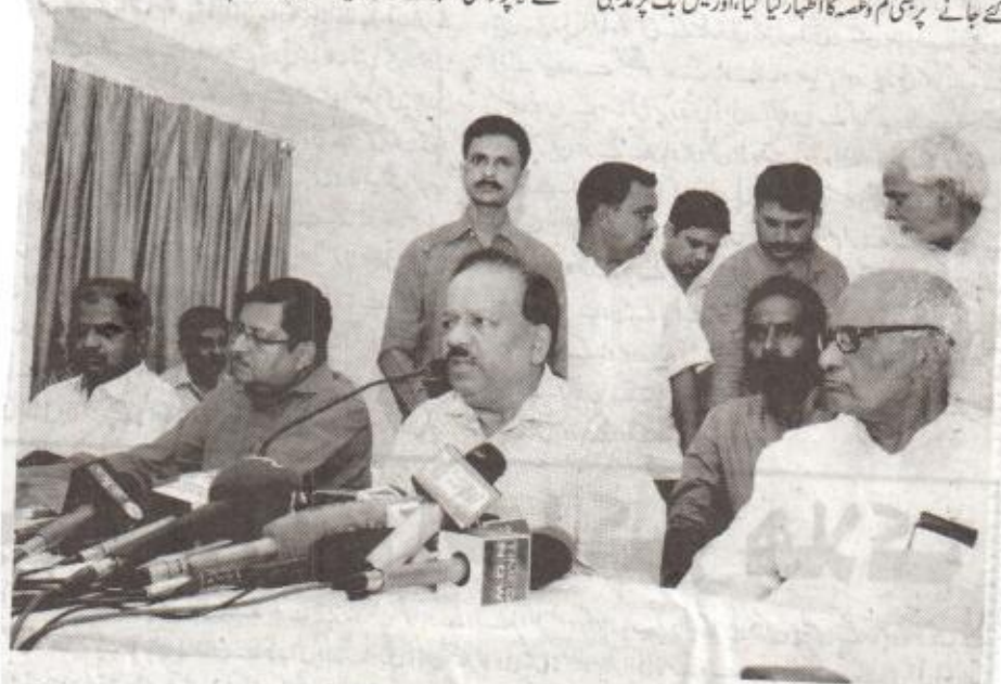
پٹنہ۔ مرکزی وزیر صحت ڈاکٹر ہرش وردھن نامہ نگاروں سے بات چیت کرتے ہوئے۔

مئی، 22 جون (آئی این ایس انڈیا) ریاست مہاراشٹر میں مسلمانوں کو ان کی آبادی کے تناسب سے 20 فیصد ریزرویشن دیا جائے جس طرح سے حکومت نے مراٹھا جمعیۃ علماء مہاراشٹر (ارشدمنی) کی مجلس منتظرہ کے اجلاس کے دوران کیا گیا۔ مئی کے جج ہاؤس میں منعقدہ جمعیت کی مجلس منتظرہ کے اجلاس میں ریاست بھر سے تقریباً 350 نمائندوں نے شرکت کی، جس کے دوران مختلف جماعتی تنظیموں کی گئی۔ مسلمانوں کو ریزرویشن دینے کے تعلق سے منظور کی گئی تجویز کے مطابق یہ مطالبہ کیا گیا کہ مراٹھا سماج کے طرز پر مسلمانوں کو ریزرویشن دیا جائے نیز حکومت ہند کی جانب سے مقرر کردہ جج کمیٹی نیز ننگا تھ مشرا کمیٹی رپورٹ کے علاوہ حکومت مہاراشٹر کی جانب سے مقرر کردہ محمود الرحمن کمیٹی نے بھی مسلمانوں کی معاشی و تعلیمی پسماندگی کا جائزہ لے کر ریزرویشن دینے جانے کی سفارش کی ہے۔ ریاستی صدر مولانا مستقیم احسن اعظمی کی صدارت میں منعقدہ اس تقریب میں محکمہ پولس کی جانب سے مسلمانوں کو بلاوجہ ہراساں اور پریشان کئے جانے نیز فسادات کے موقع پر مسلمانوں کے خلاف پولس کے متعصبانہ رویوں اختیار کئے جانے پر بھی غم و غصہ کا اظہار کیا گیا، اور فیس بک پر مذہبی