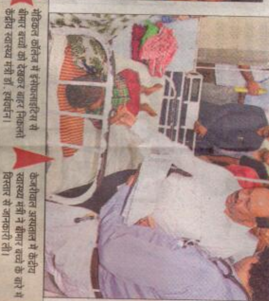
मेडिकल कॉलेज में इंसेफलाइटिस से बीमार बच्चों को देखकर वाटर निकलते केंद्रीय स्वास्थ्य मंत्री डॉ. हर्षवर्धन।