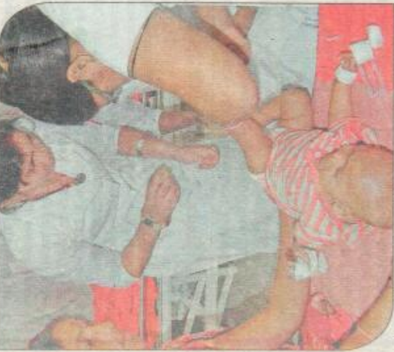
एईएस नरीज की जांच करते चिकित्सक