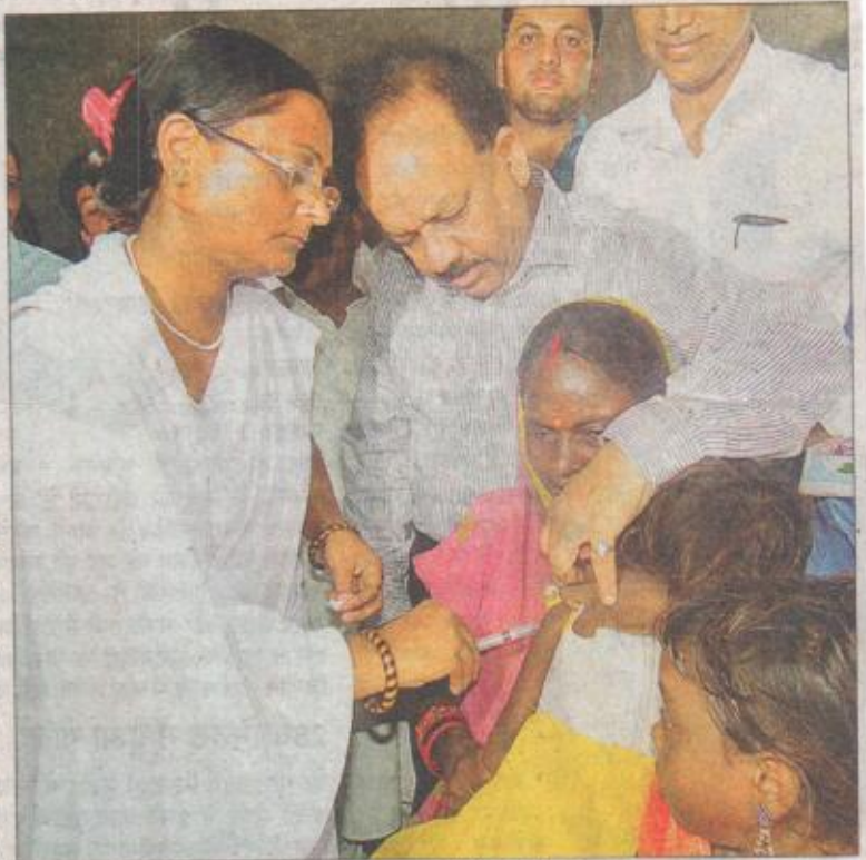
अपनी देखरेख में टीका लगवाते केंद्रीय स्वास्थ्य मंत्री डॉ. हर्षवर्धन

अधिकारी अच्छे, आधारभूत संरचना की कमी : केंद्रीय स्वास्थ्य मंत्री डॉ. हर्षवर्धन ने कहा कि राज्य के अस्पतालों व मेडिकल कॉलेजों में अभी आधारभूत संरचनाओं व संसाधनों को काफी विकसित करने की जरूरत है। आईएस ही नहीं बल्कि अन्य बीमारियों से बचाव व उसके इलाज