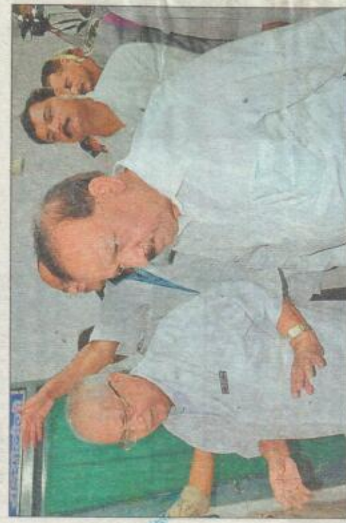
एस्केएमसीएच में डॉ. हर्षवर्धन का निरीक्षण करते केंद्रीय स्वास्थ्य मंत्री

एस्केएमसीएच में पत्रकारों से बातचीत में डॉ. हर्षवर्धन ने कहा कि एक-दो साल में राज्य से कालाजार को पूरी तरह खत्म कर दिया जाएगा। उन्होंने कहा कि मुजफ्फरपुर व आसपास के इलाके में इस बीमारी से भी काफी लोग पीड़ित हैं। इसे देखते हुए कालाजार के लिए रिसर्च प्रक्रिया का और सुदृढ़ किया जाएगा। इसके लिए कुड़नी में आएचआर्यू (रूराल हेल्थ रिसर्च यूनिट) खोली जाएगी।