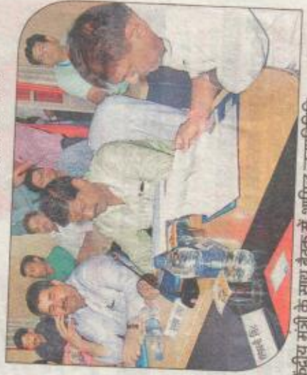
केन्द्रीय मंत्री के साथ बैठक में शामिल जनप्रतिनिधि