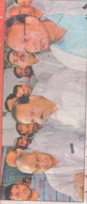
जामरथ एसकेएमसीएच पहुंचे हर्षवर्धन

बोले-बीमारी को इसेफेलाइटिस नहीं, इसेफलोपैथी कहा जाए