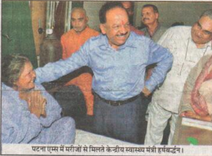
पटना एम्स में मरीजों से मिलते केन्द्रीय स्वास्थ्य मंत्री हर्षवर्द्धन ।

पटना से मुजफ्फरपुर जाने के क्रम में स्वास्थ्य मंत्री ने पार्टी कार्यकर्ताओं के स्वागत समारोह को संबोधित कर रहे थे । उन्होंने कहा कि कुपोषण, गंदगी और साफ-सफाई का अभाव के अनेक कारणों से इन बच्चों को ऐसी बीमारियों से मौत हो सकती है । उन्होंने कहा कि राज्य सरकार इन बच्चों की मौत को रोकने के लिए जिस जबाबदेही और संवेदनशीलता के साथ ऐतिहासिक कदम उठानी चाहिए थी वह नहीं उठायी गयी । स्वास्थ्य मंत्री