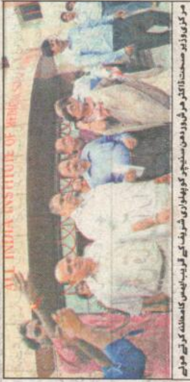
مرکزی وزیر صحت ڈاکٹر ہرٹس وورڈن میں سنیچر کو پہلوانی شریف کے قریب ایس کامعاہنہ کرتے ہوئے

100 بستروں والے ایک نیا آنی ہوئے میں مرکزی حکومت کی طرف سے مدد کرنے کی بات کی۔ مرکزی وزیر صحت نے اپنے دورے کے دوران اسپتال کی عمارتوں کی اور تعمیر کی ضرورت پر بھی زور دیا۔ ڈاکٹر ہرٹس وورڈن کے ساتھ ریاست کے وزیر صحت راجیو کمار اور دیگر صحت کے سیکشن کے سربراہی ایک پروڈھان بھی موجود تھے۔ اس سے قبل میں ڈاکٹر ہرٹس وورڈن نے پٹنہ میں آنی ہوئی طبی حیثیت آف میڈیکل ٹیکنالوجی (ایس) کونسل کو کیا اس دوران انہوں نے کہا کہ ملک میں دلایا ایس کی طرز پر کارپاسیوں میں ایس شروع کرنے کا منصوبہ سازی وزیر اعظم اے بی جہاں آبادی نے بنایا تھا۔ ہم چاہتے ہیں کہ ان کے پیمپیشن پر 25 کمر کو ایس کا افتتاح ہو۔ (تفصیلی صفحہ 9 پر)