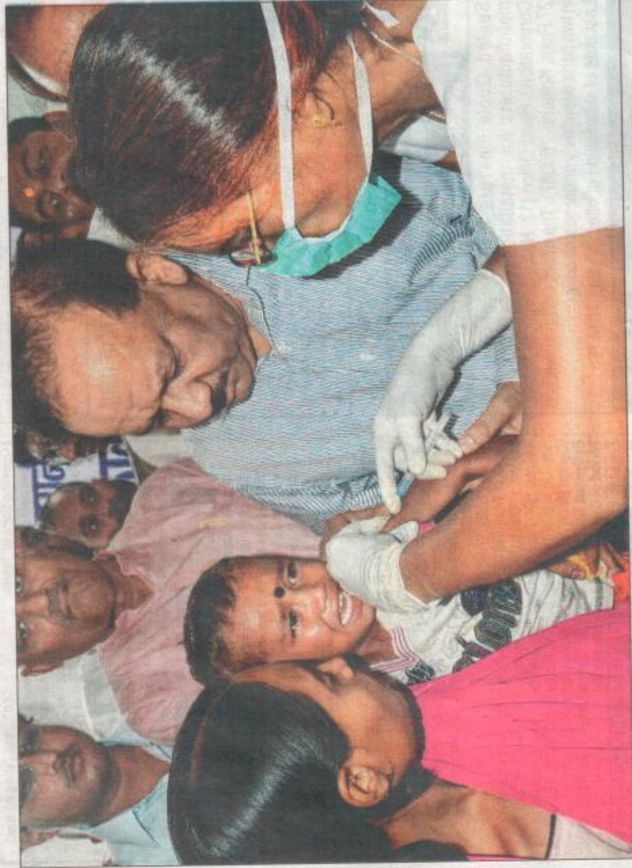
Union health minister Harsh Vardhan oversees the vaccination drive of Japanese encephalitis at Kanti primary health centre in Muzaffarpur on Sunday.

Vardhan said: "The JE vaccination should be administered to children from nine months to 15 years of