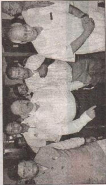
मुजफ्फरपुर के एस्केएमसीएच में जायजा लेते केन्द्रीय मंत्री डॉ. हर्षवर्धन।

डॉ. हर्षवर्धन सीधे एस्केएमसीएच पहुंचे तथा अस्पताल के चारों आईसीयू में जाकर इलाजगत बच्चों की स्वयं जांच की तथा उनके परिजनों से बीमारी से संबंधित पूछताछ