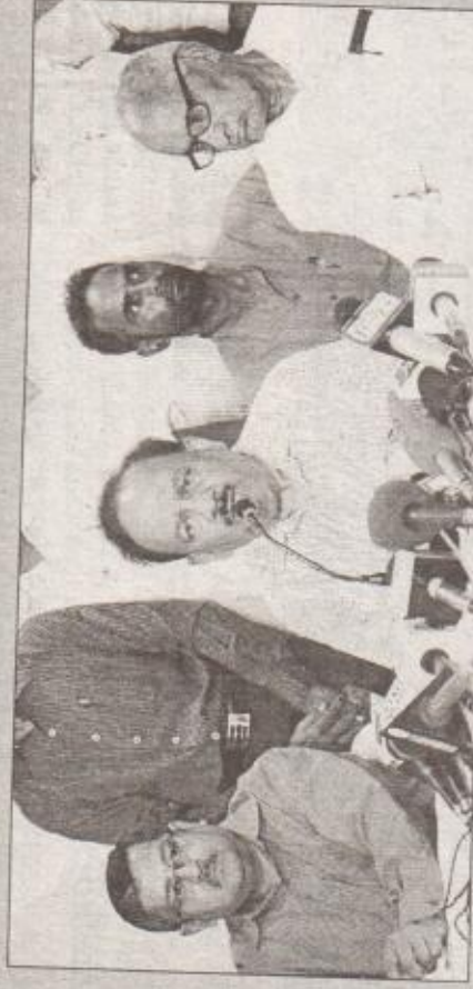
वरिष्ठ संवाददाता पटना

केन्द्रीय स्वास्थ्य मंत्री डॉ. हर्षवर्द्धन ने बिहार के मुजफ्फरपुर समेत कई जिलों में इंसेफलाइटिस जैसी लक्षणों वाली बीमारी से बड़ी संख्या में बच्चों की हो रही मौत पर गंभीर चिंता व्यक्त की और कहा कि इसके