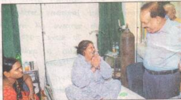
Union health minister Dr Harsh Vardhan talks to a patient during his visit to AIIMS in Patna on Saturday

The minister told the institute director and other officials to expedite the work, remove all bottlenecks and finish