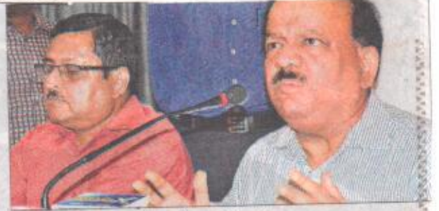
भाजपा कार्यालय में पत्रकारों से बातचीत करते डॉ हर्षवर्धन.

एम्स, पटना को मिलेगा और 100 एकड़ जमीन : डॉ हर्षवर्धन ने कहा कि एम्स, पटना दुनिया का सबसे प्रतिष्ठित सेंटर बने, इसके लिए वहां की क्रमियों को दूर कर 25 दिसंबर तक काम पूरा करने का निर्देश दिया है. एम्स का दायरा बढ़े, इसके लिए 50 से 100 एकड़ और जमीन की जरूरत पड़ेगी और इसके लिए मुख्यमंत्री से बात भी हुई है.