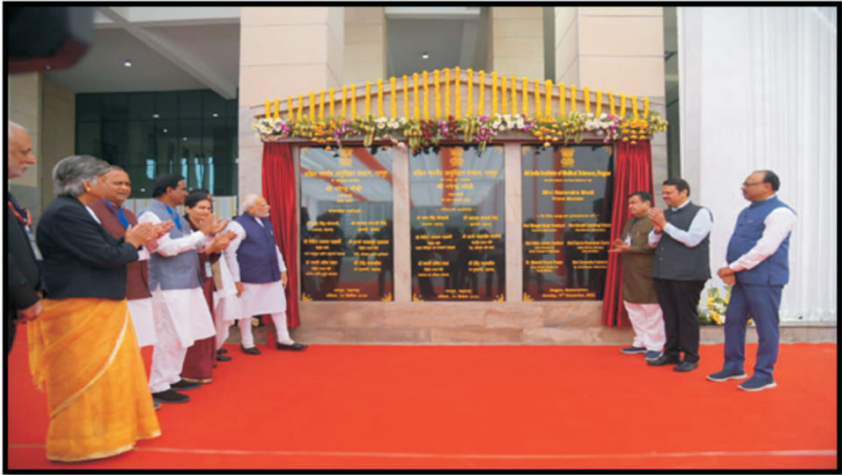
11 दिसंबर, 2022 को माननीय प्रधान मंत्री द्वारा एम्स, नागपुर का उद्घाटन