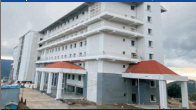
इन्दिरा गांधी मेडिकल कॉलेज शिमला, हि.प्र.