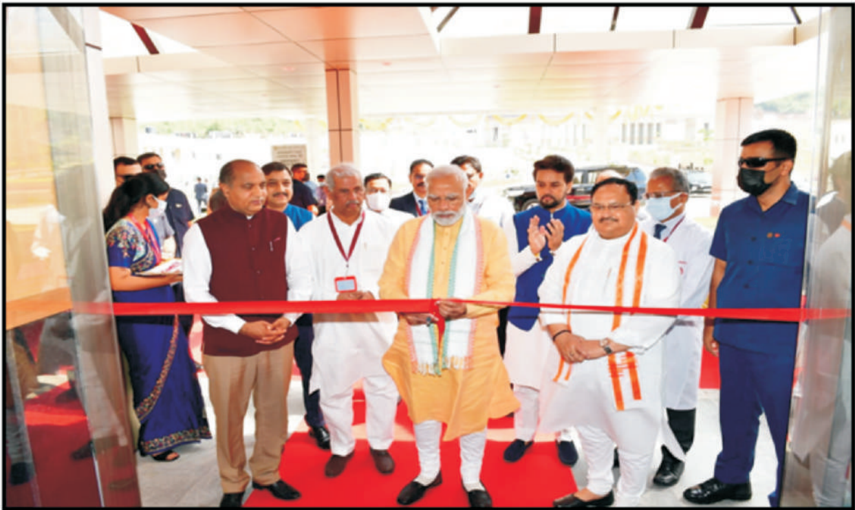
5 अक्टूबर, 2022 को माननीय प्रधान मंत्री द्वारा एम्स, बिलासपुर का उद्घाटन