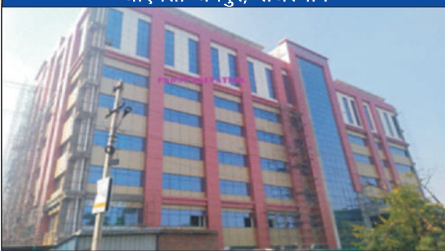
जीएमसी जयपुर, राजस्थान