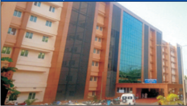
जीएमसी कोझिकोड, केरल