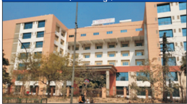
जीएमसी कानपुर, उ.प्र.